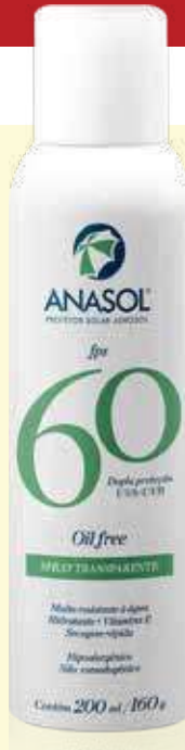
Protetor Solar Spray Transparente Anasol Aerossol | FPS 60 200ml