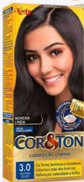
Tintura Cor&Ton Diversos