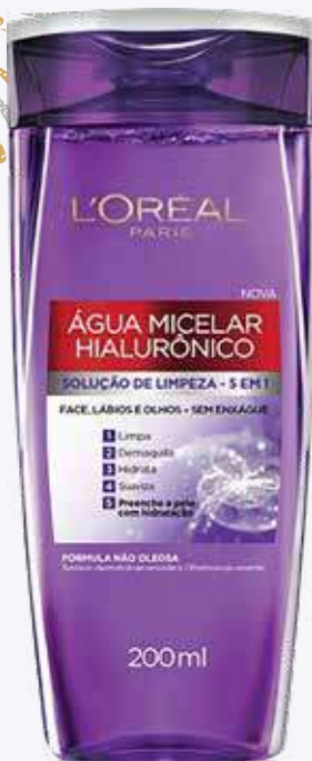
Água Micelar L'Oréal Paris Hialurônico 200ml