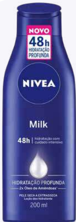
Loção Hidratante Nivea Milk 200ml