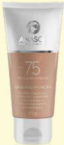
Base Multifunção Anasol FPS 75 60g