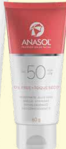
Protetor Solar Facial Anasol FPS 50 60g