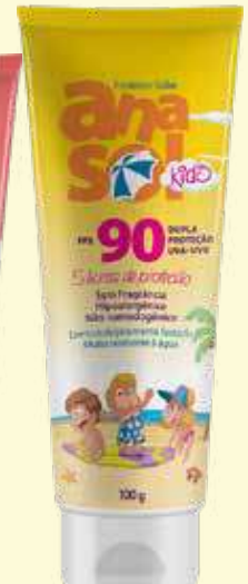
Protetor Solar Anasol Kids FPS 90 100g