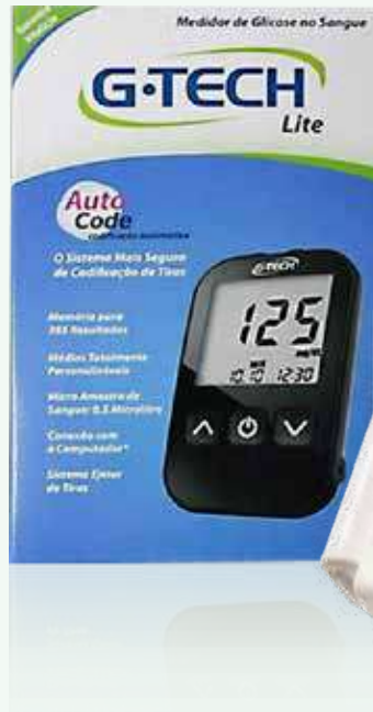
Kit Medidor de Glicose G-Tech Lite Auto Code