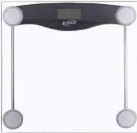
Balança Glass 10 G-Tech Digital