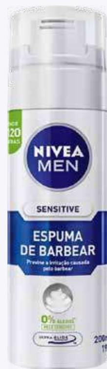
Espuma de Barbear Nivea Diversos 200ml