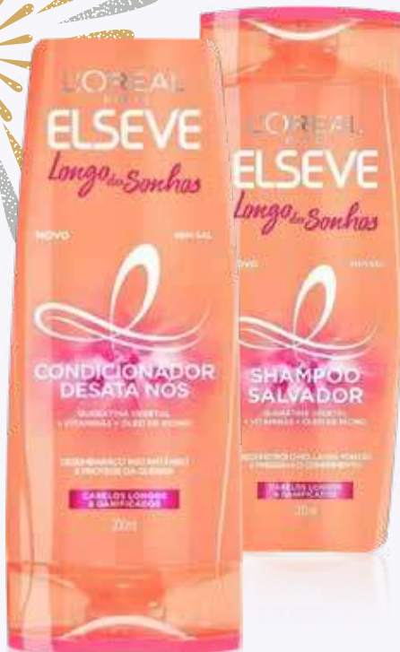
Shampoo Elseve L'Oréal Paris

Diversos (exceto Hydra Detox Anticaspa / Hidra Hialurônico) 200ml