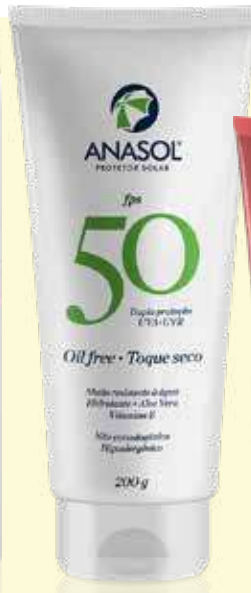
Protetor Solar Anasol FPS 50 200g