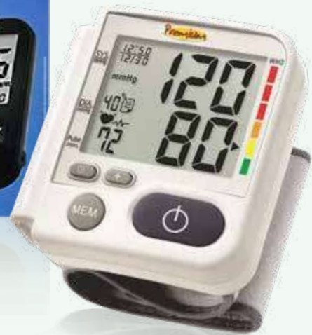
Aparelho Medidor de Pressão Arterial Digital Premium LP200