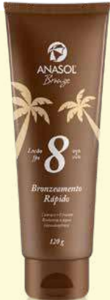
Loção Bronzeadora Anasol FPS 8 120g